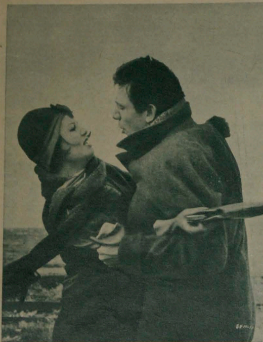
CLAUDIA CARDINALE Y ANTHONY FRANCIOSA Pasión tempestuosa.