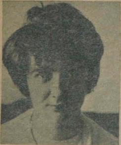
EXISTENCIALISTA Algunas pinceladas del pasado de moda existencialismo veremos en una obra de la Sagan.