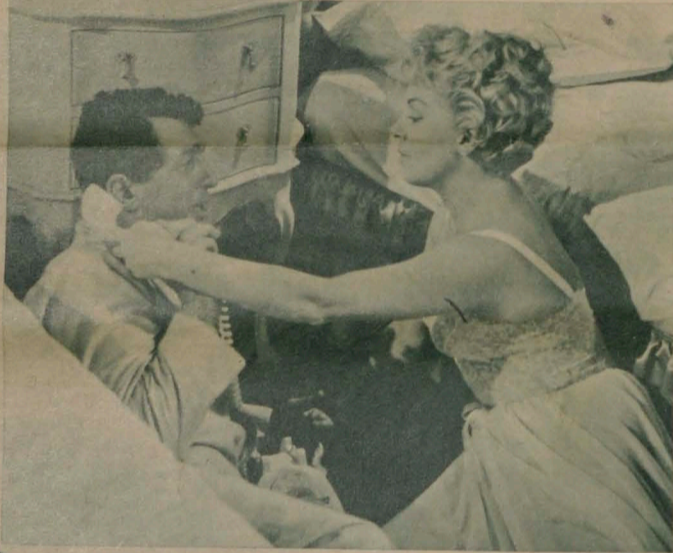
RECLAMO. — Lana Turner reclama que Dean Martin no cumple sus deberes conyugales por estar preocupado de los resultados de las carreras. Le dice: "En el hipódromo vas por Lana y sales trasquilado, en cambio aquí tienes Lana hasta hartarte..."

nal, porque falta en la actriz la verdadera inocencia y la verdadera ingenuidad infantil, reemplazando estos elementos por recursos convencionales.