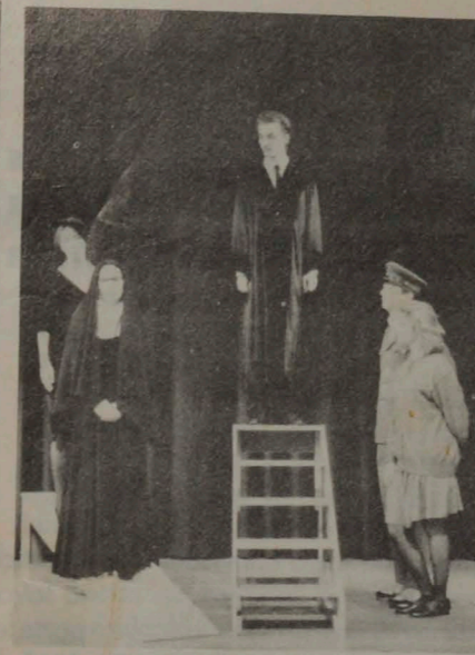
"El mal espíritu": inédita en Chile, estrenada en Alemania.

Desde hace unos años tengo perdida mi respetabilidad académica. Nadie me la quitó, pero un buen día, por razones que no me sé explicar, algo sucedió en mí. No sé qué me pasó, mas lo cierto es que de repente me descubrí incapaz, en absoluto, de pensar, hablar y escribir