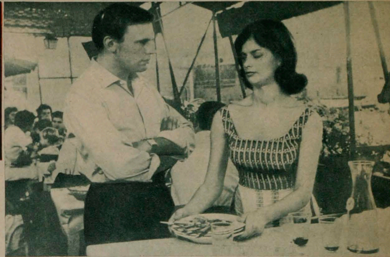
Jean-Louis Trintignant es el discípulo de Vittorio Gassman en "Il Sorpasso". Pero cuando trata de seducir a esta bella camarera, fracasa. Su profesor le mostrará cómo se hace.

DERECHA: Con esta escena entre Claudia Cardinale y Sergio Fantoni principian los últimos diez minutos de "Los Delfines", que están de más en la película. Con anterioridad, la C. C. ha tenido oportunidad de lucir sus atributos físicos y su calidad de actriz.