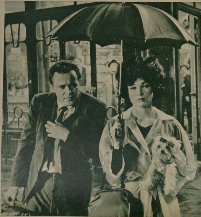
PERRA VIDA. — Jack Lemmon preferiría llevar una vida de perro y así guarecerse de la lluvia en brazos de Shirley MacLaine, pero debe contentarse con ser apenas un hombre.

Shirley MacLaine y Jack Lemmon son la mejor pareja de comediantes con que cuenta en