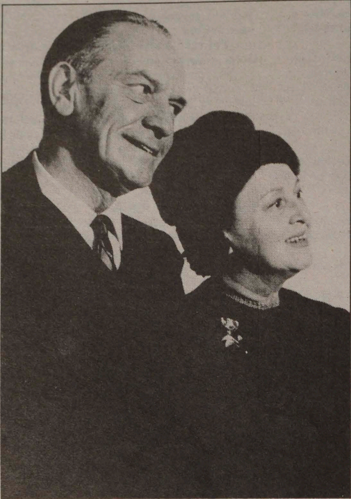
Florence Eldridge y Frederic March como Linda y Willy Loman.

ingresar a la platea fue advertir que el público estaba compuesto en su mayoría por personas mayores de 50 años. Decididamente, Miller ya no concita el interés de los jóvenes. Y a medida que avanzaba la representación fui reconociendo los mismos elementos que están presentes en toda la obra de Miller: estilo realista, personajes solidamente delineados de compleja psicología, una muy bien urdida trama dramática y una temática que apunta a la responsabilidad social. Es decir, todos los ingredientes que Miller siempre manejó en sus exitosos dramas. Sin embargo, me retiré del teatro con la sensación de haber visto una obra antigua y que, a pesar de sus méritos objetivos, no me llegó a entusiasmar como, en su oportunidad, me entusiasmaron todas las obras de Miller.