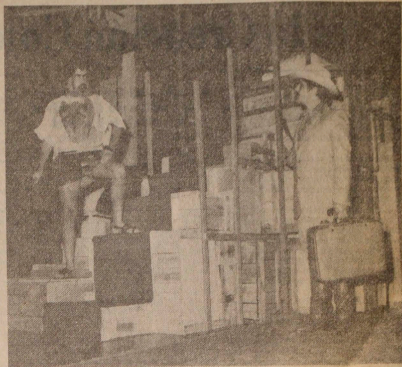
"Fifty-fifty" en la Sala CANTV.

Los mismos presentarán "La primera independencia", "La esquina del miedo" y "Fifty-fifty"