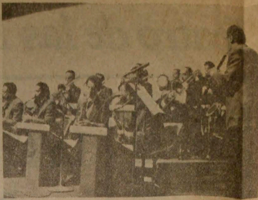
Banda Moderna de Caracas.

La Banda Moderna de Caracas está llegando a su primer aniversario con un centenar de convertidos diferentes efectuados. Fundamentalmente toca jazz de diversas épocas y música moderna y latinoamericana. Para hoy se anuncian autores como Miller, Basie, Ellington, Lecuona, Show, Blanco, entre otros. En la parte segunda será la exhibición Travolta y en el jazz improvisado se anuncia jazz al estilo dixieland. Hoy, como todos los lunes, la cita es en el Teatro Flexible a las 8 de la noche.