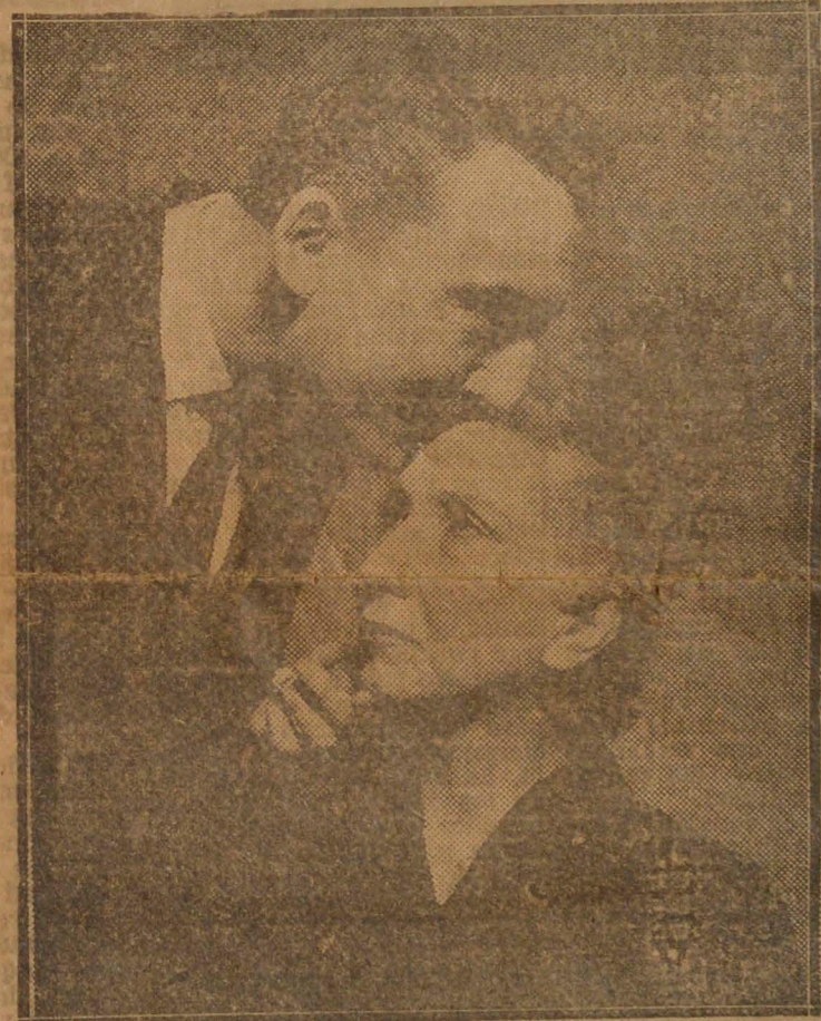
"El Senador no es honorable", presentación de 'El Teatro de Ensayo'.

La verdad es que nos hemos llevado una sorpresa. La obra de Miguel Frank difiere de todas las estrenadas durante la temporada, en la ausencia total de pretensiones dramáticas. El autor se ha limitado a entretener a su público con un argumento