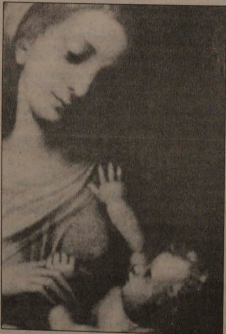
"Madonna con niño", de Corregio.

Los cuadros en cuestión son: Retrato de Francisco I , de Velázquez; Madonna con