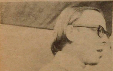
Sr. Jaime Guzmán, representante de los académicos (Derecho).