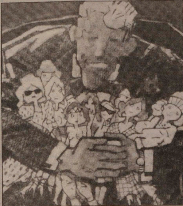
"Son la segunda generación de actores que están formando en sus respectivas familias una tradición..."

Muchos e importantes aportes hicieron a la vida cultural y social del país quienes fundaron los teatros universitarios hace ya cerca de medio siglo, pero tal vez el más importante y significativo sea éste que ahora reseño: haber dado dignidad y aceptación a la profesión del actor hasta llegarla a convertir en una de aquellas que, con orgullo, los padres traspasan a sus hijos y éstos a los hijos que tendrán.