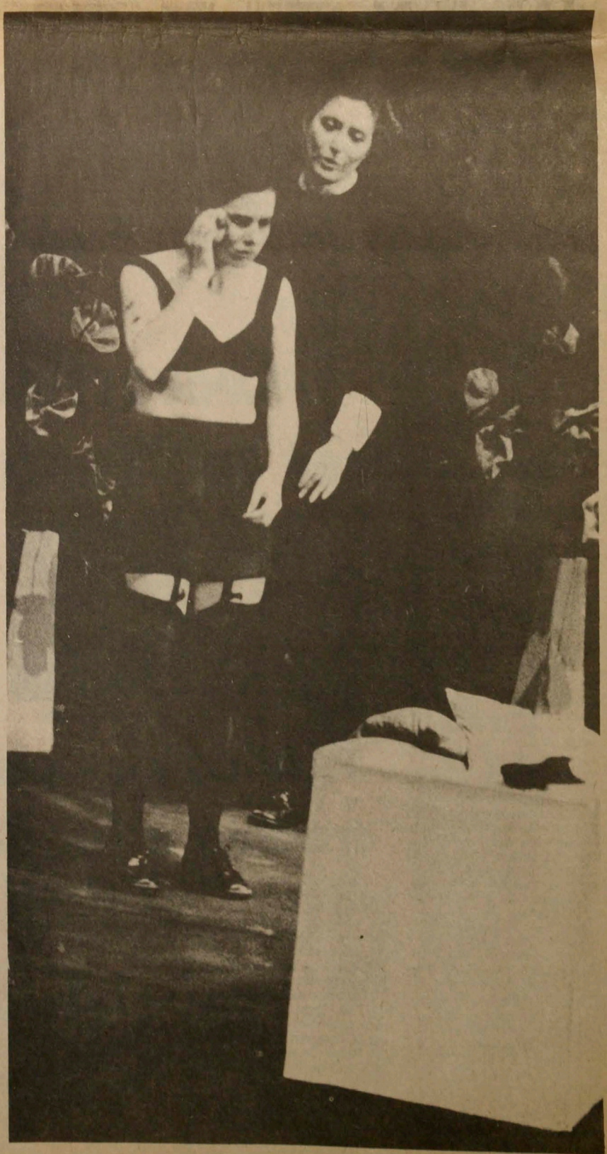
Una escena de "Las Criadas" de Jean Genet, presentado por el grupo de Córdoba, de la República Argentina, que ayer triunfó rotundamente en el III Festival de Teatro Universitario de Manizales. (Foto Sarmiento).