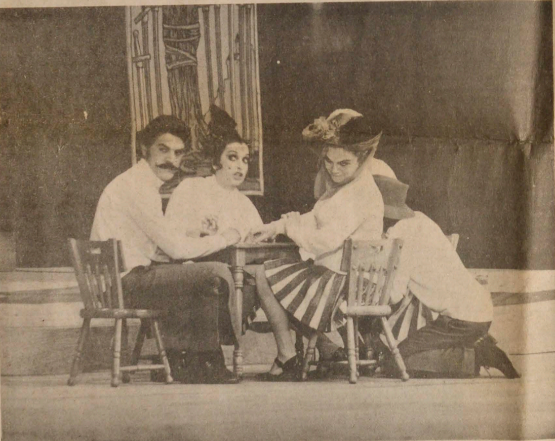
MANIZALES - Esta escena captada por nuestro reportero gráfico muestra varios actores y actrices del Grupo de Teatro de la Universidad Autónoma de México, el cual presentó durante el Tercer Festival la obra "El Juego de Zuzanka", una comedia del absurdo que logró bastante aceptación entre los espectadores.

nima culpa de no tener ningún conocimiento teatral. Ellos no tienen la culpa de intentar una aventura. Ya dijimos que eso lo hacen todos los grupos Universitarios. Pero su presencia aquí, en un Festival Latinoamericano de Teatro Universitario no nos la explicamos. Eso debiera aclararse muy bien. Eso no puede quedar en la oscuridad porque las versiones son muchas. Si Vodanovic, su amigo, su don de gentes, su cariño a Manizales influyeron para que su obra se representara aquí sin tener en cuenta qué clase de obra era y sin importar el grupo que la trajera, es un hecho muy grave. La reacción del público es apenas natural. El público paga para ver teatro, buen teatro, y no tiene tiempo para entrar en consideraciones de orden humano. El público no puede pensar que el grupo no tiene la culpa. El público no puede pensar que eso suceda con frecuencia en las Universidades. Nada de eso. El público exige buen teatro y basta. Entrar ahora en consideraciones de orden técnico nos parece completamente inútil. Entrar a analizar a fondo la obra sería tiempo perdido. La reacción del público frente a una cosa sin pies ni cabeza es mucho más elocuente. De otra parte, y aunque no debiéramos hacerlo por la tan cacareada objetividad crítica, sólo nos resta sentar nuestra voz de protesta por lo que se vivió en Fundadores en la noche del viernes. No hay derecho!