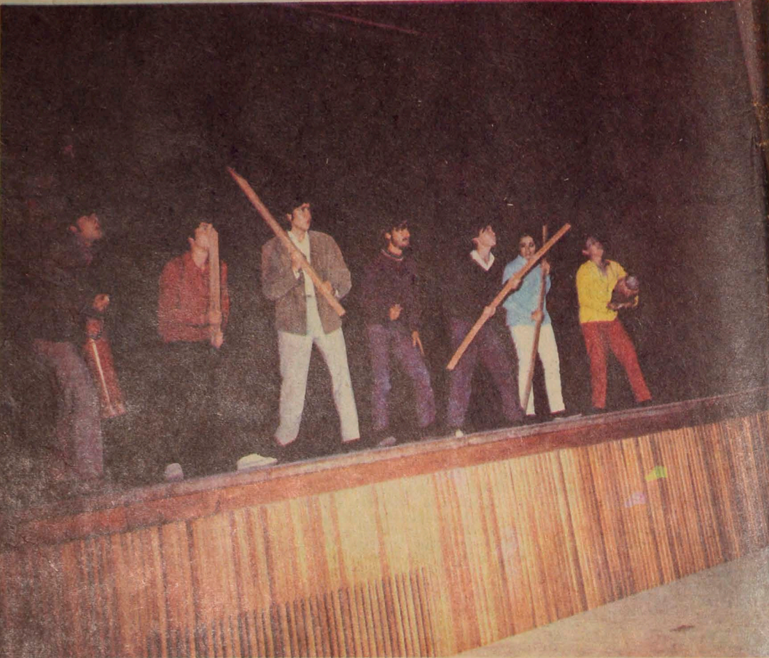
MANIZALES.- (Foto-color de Sarmiento LA PATRIA).- El Teatro Ensayo de la Universidad del Norte de Arica, Chile, puso en escena la obra "Nos tomamos la Universidad", del autor Sergio Vodanovic. El grupo hizo meritorios esfuerzos por expresar el mensaje del conocido autor chileno. (Ver páginas octava y novena de esta edición).