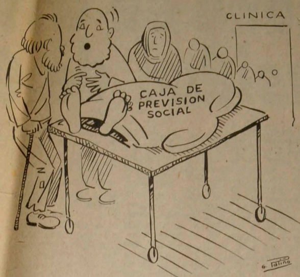
EL JUBILADO: Oye, a tí no te parece que este ya colgó los tenis?