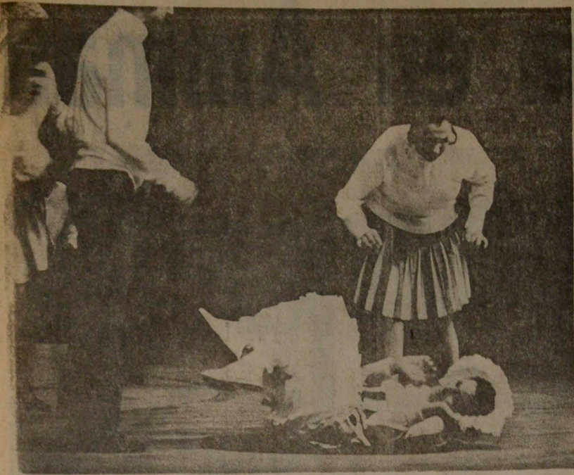
Aspecto de la obra "El juego de Zuzanka", que presentó el Grupo de la Universidad Autónoma de México, en la continuación del III Festival de Teatro Universitario que se efectúa en Manizales.