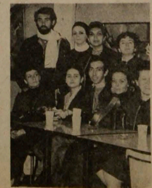
Otros integrantes de la "troupe"

dicó: —Pienso que las obras que se incluyan en los próximos Festivales deben ser de autores contemporáneos de cada país, para saber lo que se está haciendo en cada uno y así tener una idea de lo que se hace en el teatro.