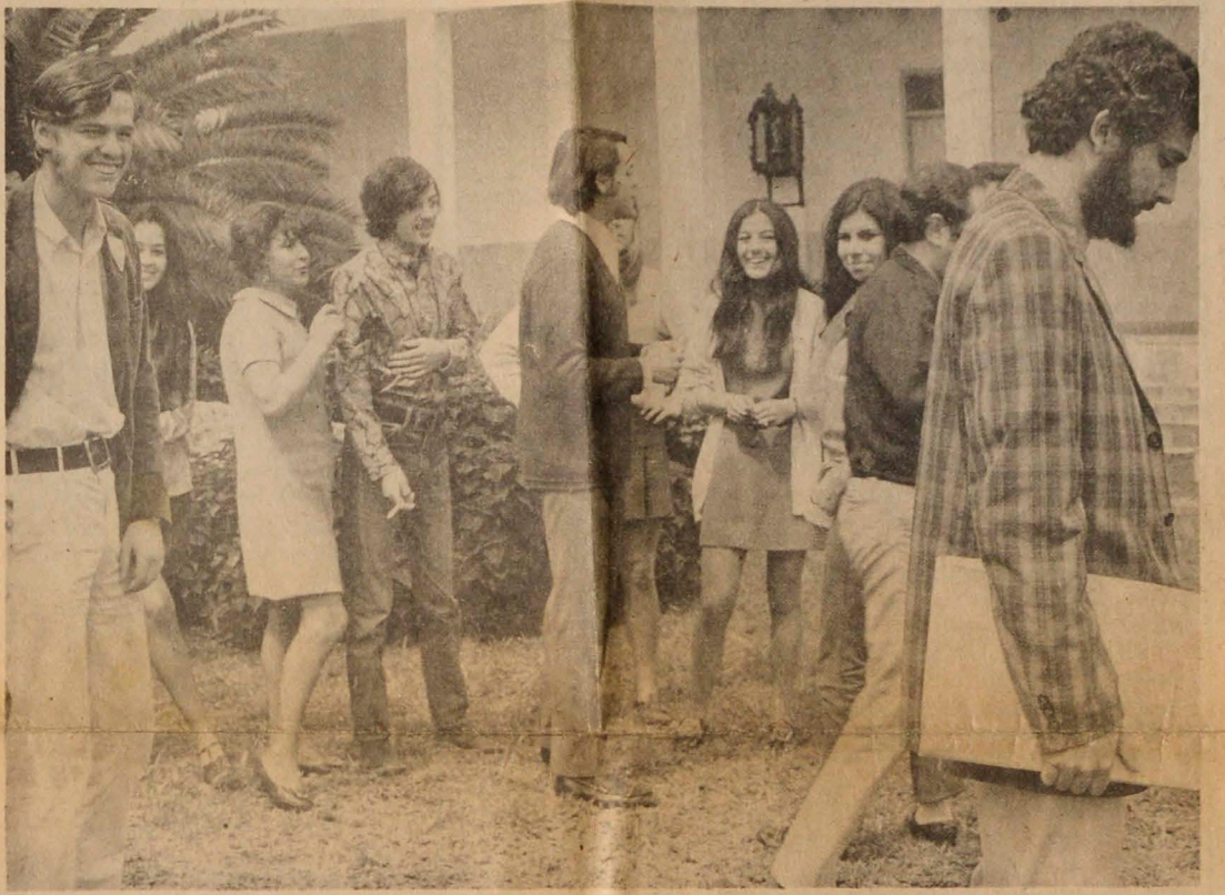
MANIZALES. Este es parte del grupo de la Universidad Católica de Chile, que esta noche debuta con la obra de Jorge Díaz, "Topografía de un desnudo".

Esto es todo lo que me ha motivado a poner en escena "TOPOGRAFIA DE UN DESNUDO".