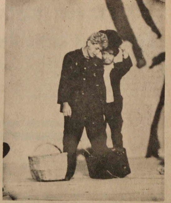
MANIZALES, (Foto Sarmiento LA PATRIA). Un aspecto de la representación de la obra "Esperando a Godot", a cargo de la Universidad Autónoma de Querétaro, de Méjico. Los actores mejicanos hicieron esfuerzos por agradar al público con este trabajo.

Si se habrá dando cuenta el gobierno de Caldas de la importancia que tiene este certamen no solo en Colombia