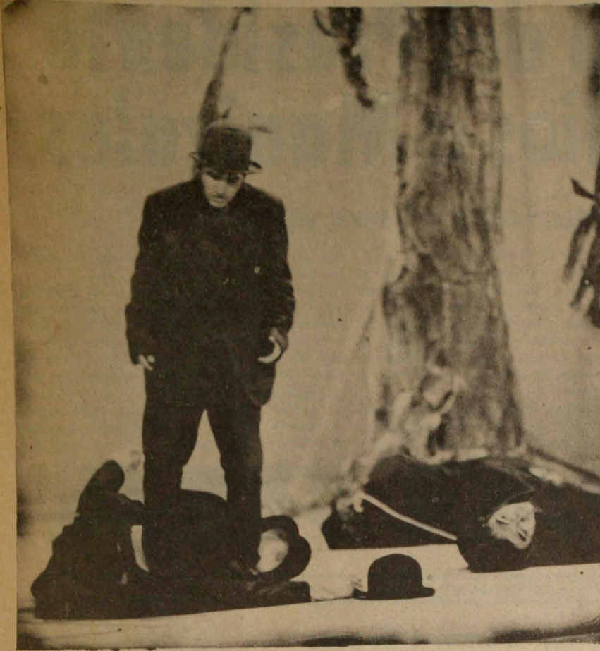
MANIZALES, (Foto Sarmiento LA PATRIA). "Esperando a Godot", fue la obra presentada por el grupo de la Universidad Autónoma de Querétaro, de Méjico, en el Teatro de los Fundadores. La escena capta un aspecto de la representación.