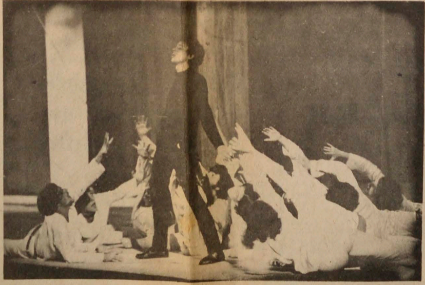
MANIZALES, (Foto Sarmiento LA PATRIA). "Comala", de Juan Rulfo, fue presentada por el grupo de la Pontificia Universidad Católica de Sao Paulo, Brasil, para inaugurar el II Festival Latinoamericano de Teatro Universitario, con el má grande éxito.