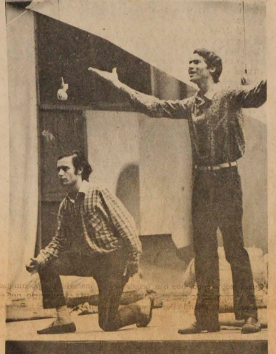
MANIZALES, (Foto Sarmiento LA PATRIA). El grupo "El Juglar", de la Universidad de Córdoba, Argentina, puesto en escena la obra "Pic-Nic en el campo de Batalla", del autor Fernando Arrabal, que abrió la temporada popular en el Coliseo Cubierto, con el mejor de los éxitos.