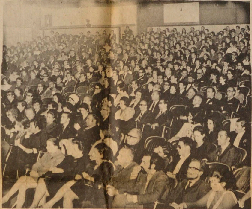
MANIZALES, (Foto Sarmiento LA PATRIA). El público ha sido el factor definitivo en el éxito del II Festival Latinoamericano de Teatro Universitario. Aquí aparece la sala del Teatro de los Fundadores, completamente colmada el día de la inauguración.