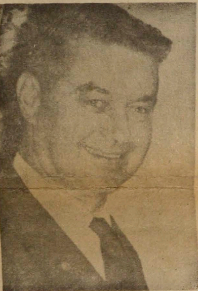
ERIC STRAESSIE Cónsul de Suiza Herido

Gravemente herido el padre de una de las víctimas —Piden cinco millones de pesos por el rescate— Intensa cacería humana —Erick Straessler, es el Cónsul de Suiza en Cali— Viaja el Embajador de la nación amiga — 300 mil pesos de recompensa —.