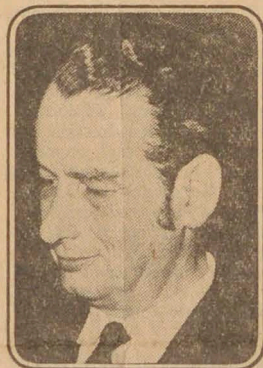
Sergio Vodanovic quien hará parte del jurado del Festival Latinoamericano de Teatro Universitario de Manizales.

—¿Ha escrito teatro? "He tenido la mala tentación, pero lo que he escrito por ciento como más del noventa por ciento