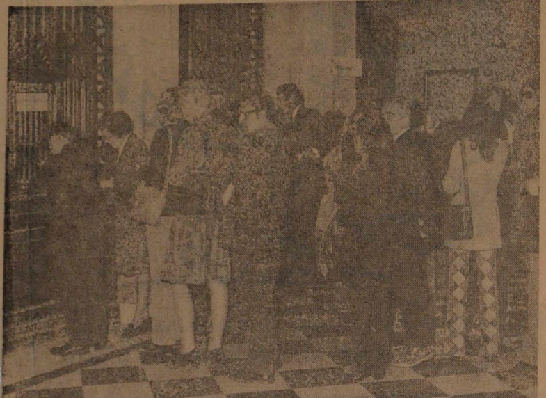
Una amplia acogida ha tenido en la ciudadanía la campaña de recolección de dinero para la reconstrucción nacional iniciada por las Fuerzas Armadas. En el grabado, dos aspectos de cajas habilitadas en el Banco Central para este objeto