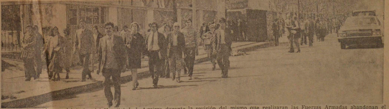
Personas retenidas en el interior del Hospital J. J. Aguirre durante la revisión del mismo que realizaron las Fuerzas Armadas abandonan el establecimiento al terminar el operativo militar