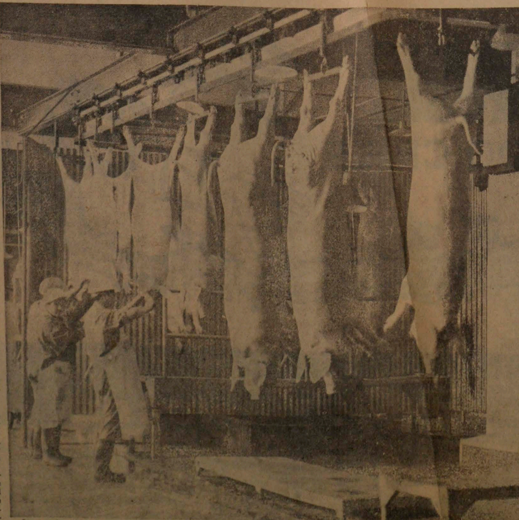
Luego de estar inactivo desde su construcción, comenzó a trabajar el Matadero de Lo Valledor, dependiente de SOCOAGRO. Ayer empezó a operar el matadero de cerdos, de modernísima construcción y equi-

En los corrales existe gran cantidad de corderos listos para el beneficio, lo mismo que vacunos que irán al matadero el lunes próximo.