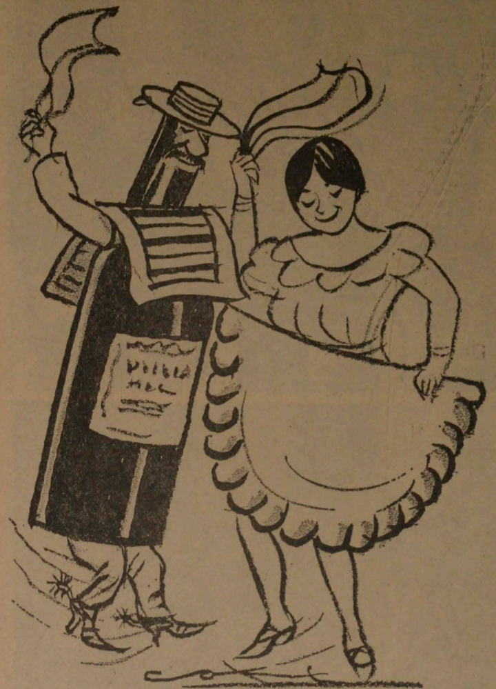
EL TINTO — La UP decía, mijita, que su revolución sería con empanadas y vino tinto. LA EMPANADA — Y sin embargo tuvimos que esperar su caída para bailar la cueca de punta y taco.