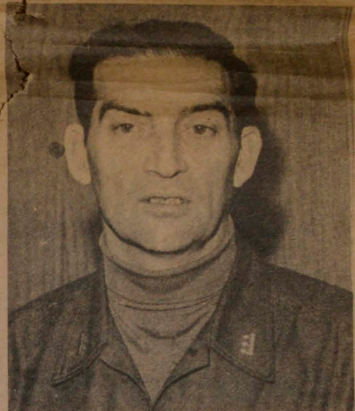
CORONEL PEDRO EWING, Secretario General de Gobierno.

Agregó el coronel Pedro Ewing que todos los detenidos de la provincia de Santiago se encontraban en el Estadio Nacional, ya que los que anteriormente habían sido llevados al Estadio Chile estaban ahora en el Nacional.