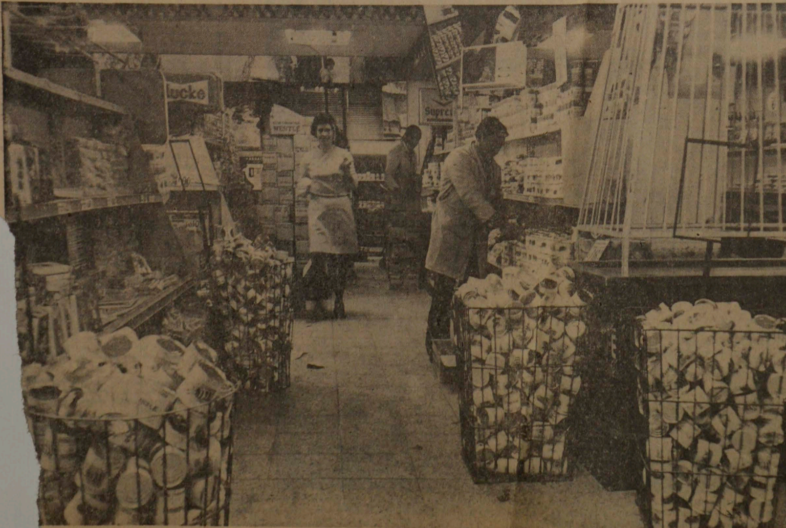
Latamente se va normalizando el abastecimiento a la población. En la foto puede apreciarse el aspecto que ofrecía ayer un supermercado. Estos artículos esenciales de consumo fueron posteriormente puestos a disposición del público.