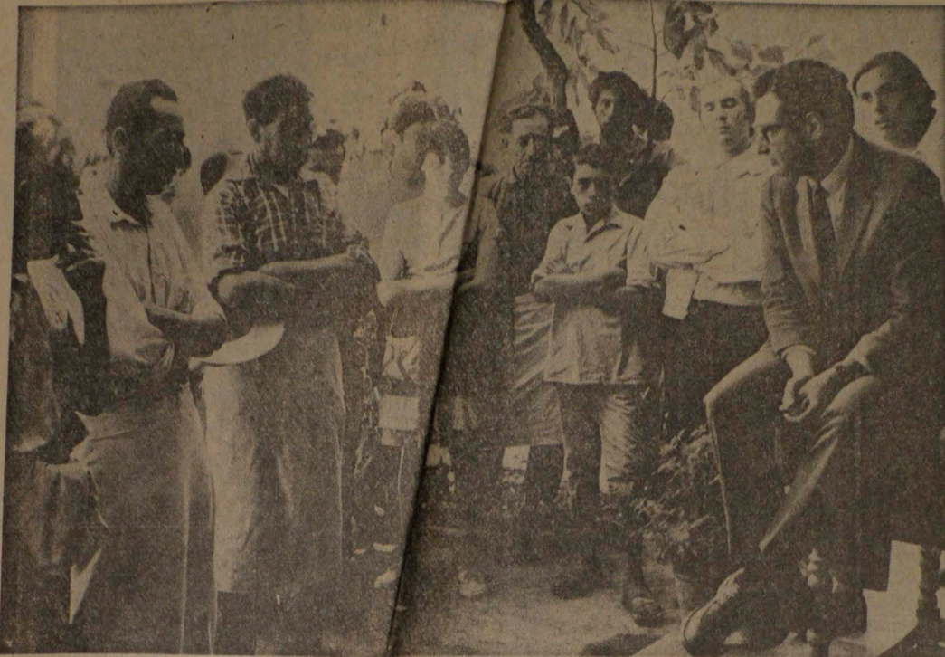
Jacques Chonchol, ex Ministro de Agricultura, promete sus títulos de dominio a los campesinos, títulos que nunca vieron los trabajadores agrícolas

Marzo 22. — En la inauguración del año lectivo, en el Centro de Perfeccionamiento de Suboficiales de Carabineros,