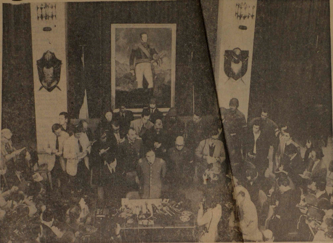
El Presidente de la Junta de Gobierno, general Augusto Pinochet, aparece rodeado de periodistas durante la conferencia de prensa ofrecida ayer en la Escuela Militar. El general Pinochet anunció que los partidos marxistas serán puestos fuera de la ley. Preciso que la tarea emprendida por la Junta Militar tiene un carácter eminentemente nacional y de recuperación del país.

Preguntado sobre el origen del pronunciamiento militar, el General Pinochet reiteró: "Ha