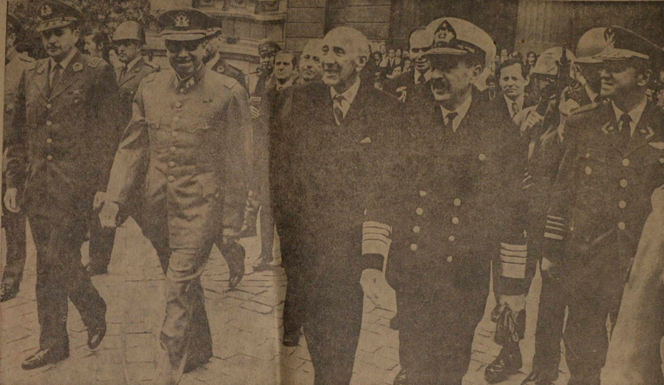
El Presidente de la Corte Suprema de Justicia, señor Enrique Urrutia manzano, acompaña a la salida de los tribunales a los miembros de la Junta Militar, General Augusto Pinochet, Almirante José Toribio Merino, General del Aire Gustavo Leigh Guzmán y General Director de Carabineros César Mendoza.

En su discurso, el Presidente de la Corte Suprema expresó: "Esta Corte Suprema, que tengo el honor de presidir, recibe con satisfacción y optimismo esta visita vuestra, y la aprecia en todo su valor histórico y jurídico; ella significa para nosotros, y asimismo para el país, una ratificación más a las primeras declaraciones que habéis prestado, en orden a que respetaréis a este Poder Judicial, y que vuestro Gobierno cumplirá nuestras decisiones."