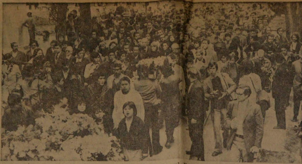
El cortejo que acompañó los restos del poeta nacional y Premio Nobel, Pablo Neruda, ingresa al Cementerio General. Personalidades del arte asistieron al sepelio, en el cual se leyeron poemas inmortales del vate