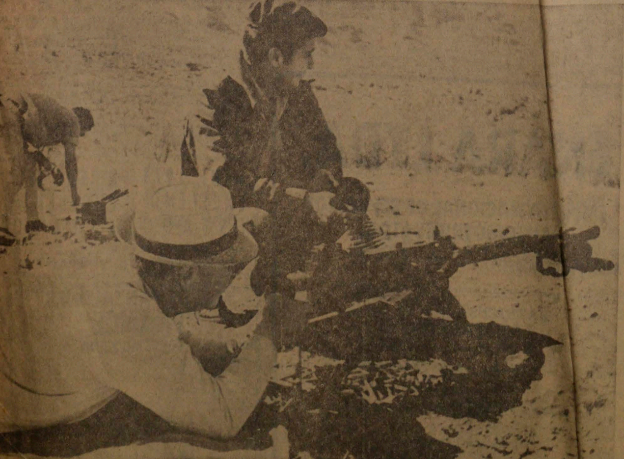
Salvador Allende, durante un ejercicio de tiro en terrenos de un campo cercano a la ciudad, se le observa disparando con una ametralladora secundado por miembros de la Embajada cubana. En el suelo se ven numerosas vainillas de proyectiles ya disparados.