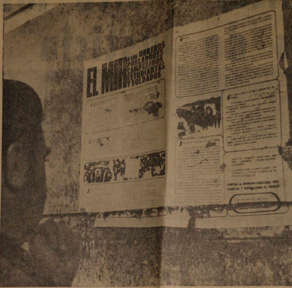
Panfleto que aparecieron en comunas y en el centro de Santiago, donde el MIR hizo un llamado a la "movilización de masas". Transentes rompieron con indignación muchos de estos carteles.

Julio 5.º. — Los muros de Santiago se repletaron de afiches del Movimiento de Izquierda Revolucionaria (MIR) que llaman "a los obreros, campesinos, estudiantes y soldados a oponerse" a los intentos sediciosos de la derecha y del freismo demócratacristiano.