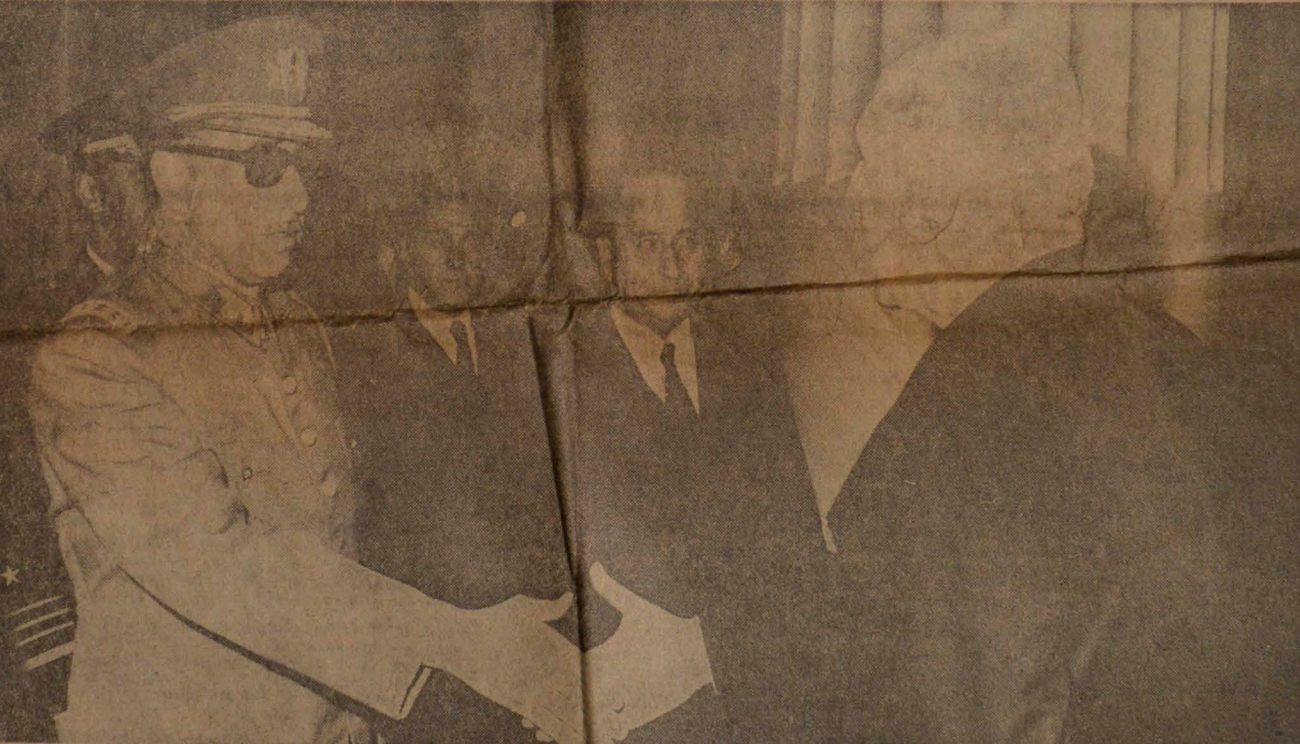
El Presidente de la Junta Militar, General Augusto Pinochet, a su llegada con los otros miembros del Gobierno, al Palacio de los Tribunales, saluda al Presidente de la Corte Suprema, señor Enrique Urrutia Manzano.