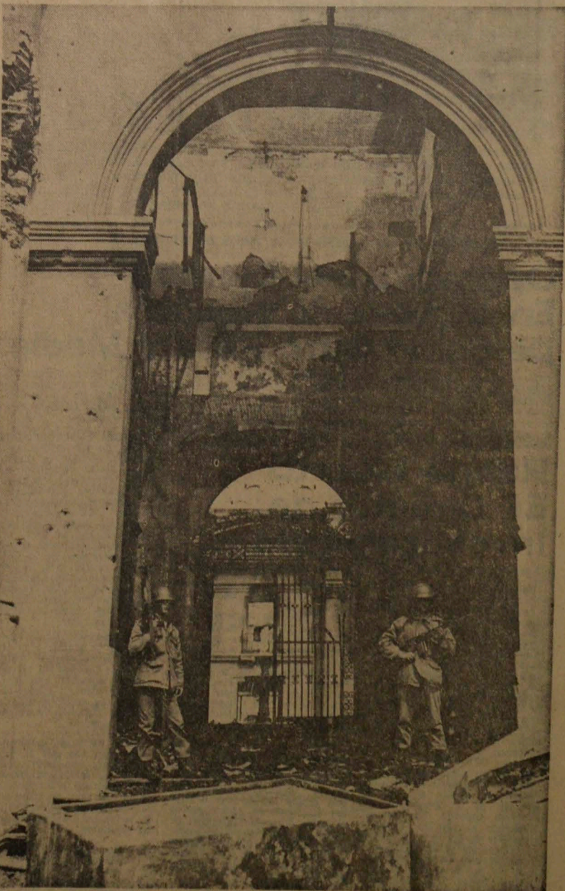
El grabado muestra en toda su magnitud lo que fue el ataque de las fuerzas militares a la Casa de Toesca. La entrada principal aparece totalmente destruida y con vigilancia de soldados premunidos de fusiles automáticos