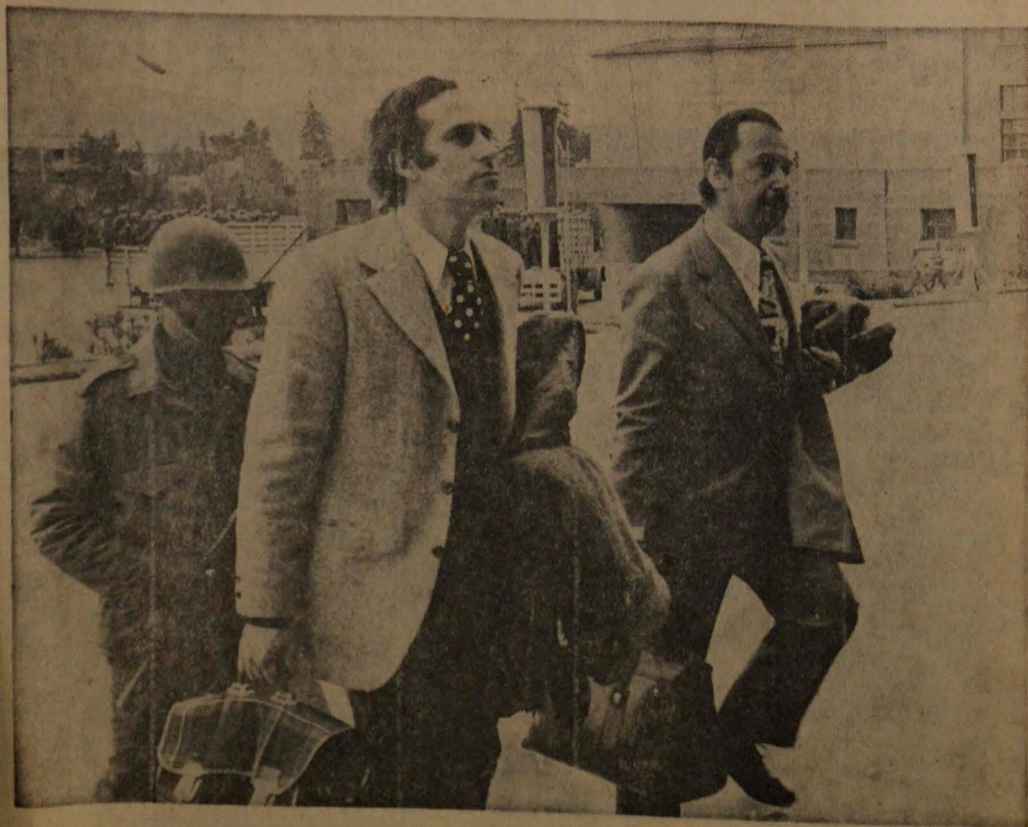
Ingresan detenidos a la Escuela Militar el ex Ministro de Educación en el Gobierno de Allende, Jorge Tapia (a la derecha) acompañado de otro alto funcionario del ex régimen marxista