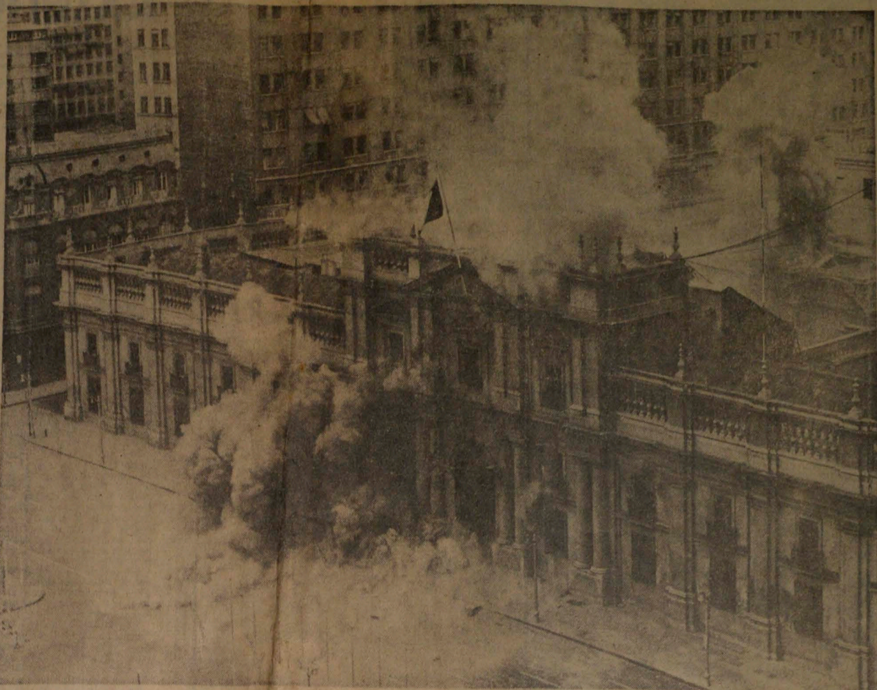
Esta espectacular fotografía, captada desde el decimotercer piso del Hotel Carrera, muestra el instante en que uno de los aviones a reacción de la FACH deja caer tres "rockets" sobre el Palacio de la Moneda, provocando una violenta explosión y humareda.

La revolución que hoy está en curso no estalló para servir sectores, sino para redimir a Chile de la inminente instauración de una dictadura marxista que la inmensa mayoría del pueblo resiste y cuyos primeros pasos subrepticios provocaron una inenarrable situación de crisis económica, social y moral, con su cortejo de hambre, miseria y persecución política.