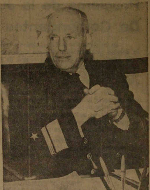
Ministro de Relaciones Exteriores, contralmirante Ismael Huerta

"Chile ha sido el país que impulsó con más decisión el nacimiento y la estructuración del Pacto Andino. De acuerdo con esa tradición y con el imperativo que representa la integración regional en el mundo de hoy, el Gobierno vigorizará, por todos los medios a su alcance, la labor que están desarrollan-