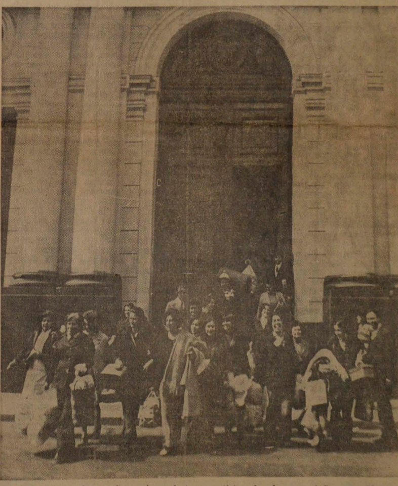
A las 9 horas de ayer las mujeres de transportistas abandonaron el Congreso Nacional, donde permanecieron durante varias semanas, en señal de protesta por la negativa del gobierno marxista de solucionar el conflicto que afectaba a los camioneros

Por eso, el Poder Femenino llama a todas las mujeres chilenas a que, una vez más, demuestren su inagotable espíritu de sacrificio y a colaborar con las Fuerzas Armadas para que Chile permanezca libre, solidario, progresista y pleno dueño de su destino".