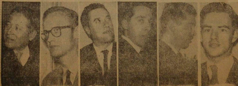
N. Guzmán. C. Huneus. E. Lihn. R. Ravanal. M. San Martín. J. Teillier.