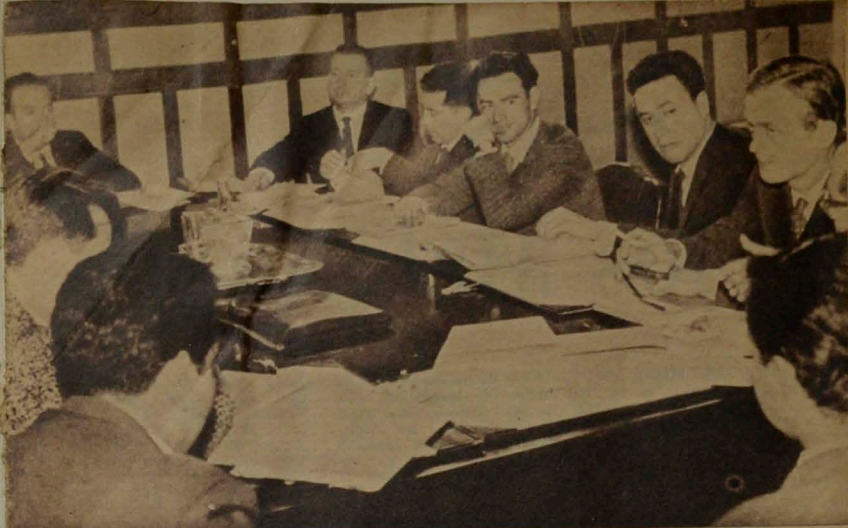
SONRIEN, FUMAN, SE DUERMEN, PERO NO BOSTEZAN. Definiciones de Alegria para los diez escritores invitados a trabajar con comodidad y holgura en el taller de Concepción.