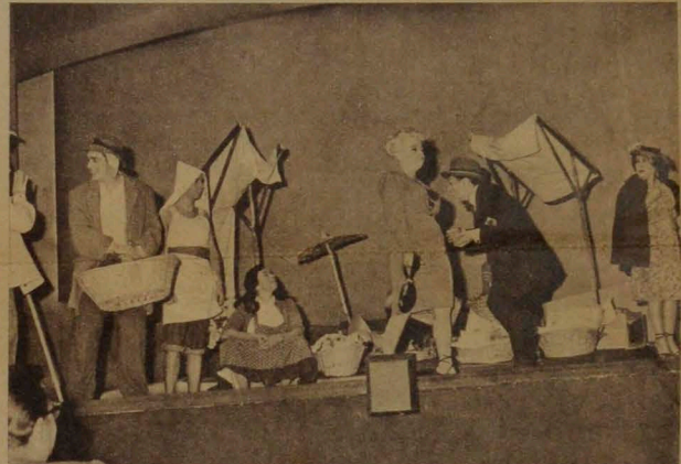
VERSOS DE CIEGO Comparaciones con Valle Inclán y García Lorca.

atracción... El contacto con lo popular y la esperanza inextinguible es lo que da a la obra calidad y hondura, y compensa de una cierta monotonía inevitable. (N. G. R., en Ya.)