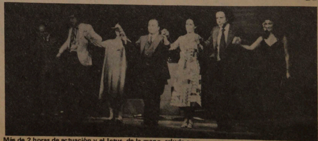
Más de 2 horas de actuación y el Ictus, de la mano, saluda a un público que aplaude de pie.

— Quizás podríamos hablar de un "existencialista escénico". Se parte del actor y su problema. Así, la creación colectiva es una especie de terapia de grupo que tiñe al personaje.