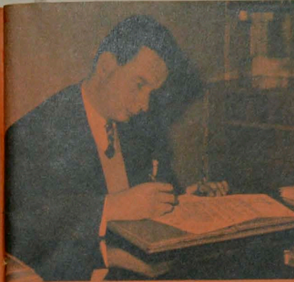
SERGIO VODANOVIC Firma contrato para llevar al celuloide su famosa obra.

POR FIN parece que la rubia Lana Turner ha aprovechado las dolorosas