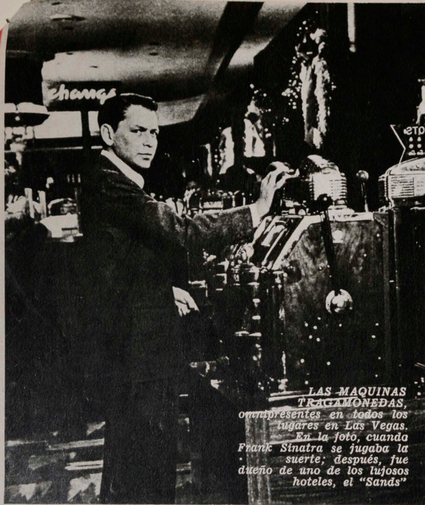
LAS MAQUINAS TRAGAMONEDAS, omnipresentes en todos los lugares en Las Vegas. En la foto, cuando Frank Sinatra se jugaba la suerte; después, fue dueño de uno de los lujosos hoteles, el "Sands"

y los restaurantes y las tiendas. Las Vegas no cierra nunca. La mayor sorpresa que recibe el viajero primerizo es que al levantarse la primera mañana en el Strip, baja al piso principal y ahí encuentra, no importa la hora que sea, a la misma gente —o al menos pareciera que fuera la misma, pues debe suponerse que se ha renovado— que ha dejado jugando la noche anterior.