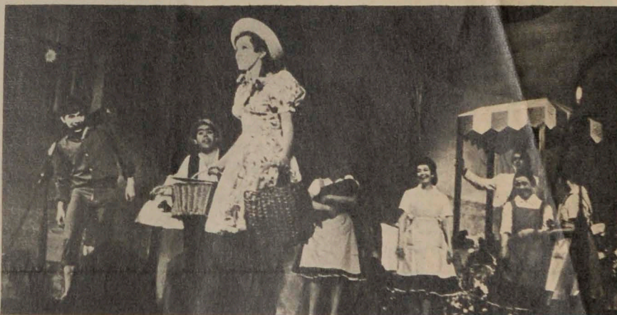
"LA PERGOLA DE LAS FLORES", la obra más taquillera del teatro chileno en 1969.

tro sabiendo ya, estadísticamente, cuán pocos son quienes asisten a una representación dramática.