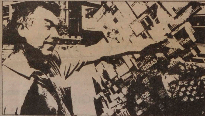
El dilema de los suplementeros: vender o no vender revistas con "piluchas", ya que pornografía no es lo mismo que erotismo.