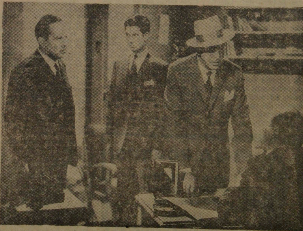
★ Otra escena de las muchas que destacan “Deja que los perros ladren” como la mejor película chilena filmada en todos los tiempos. Es una producción “Producine”, que se rodó bajo la dirección de Naum Kramarenco.

La exhibición privada de “Deja que los Perros Ladren”, tuvo proyecciones inmediatas. Distribuidores de Valparaíso se pusieron en contacto con los ejecutivos de la capital y consiguieron fecha de estreno en el vecino puerto para el 4 de octubre en el cine Colón. Pero lo que más ha consagrado la calidad indiscutible de la película de “Producine” es que fue seleccionada para representar a nuestro cine en la Semana Chilena que