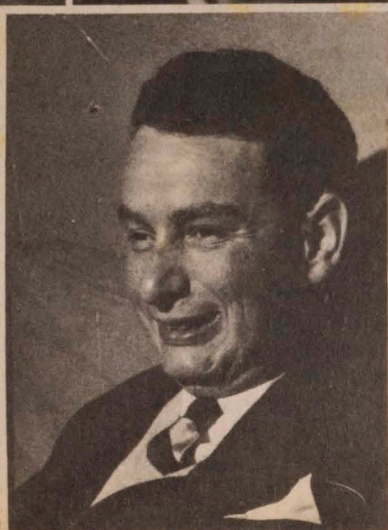
Hace tres décadas: Egon Wolff, María Asunción Requena, Alejandro Sieveking, Fernando Debesa (arriba) y Luis Alberto Heiremans, Sergio Vodanovic, Isidora Aguirre (abajo)