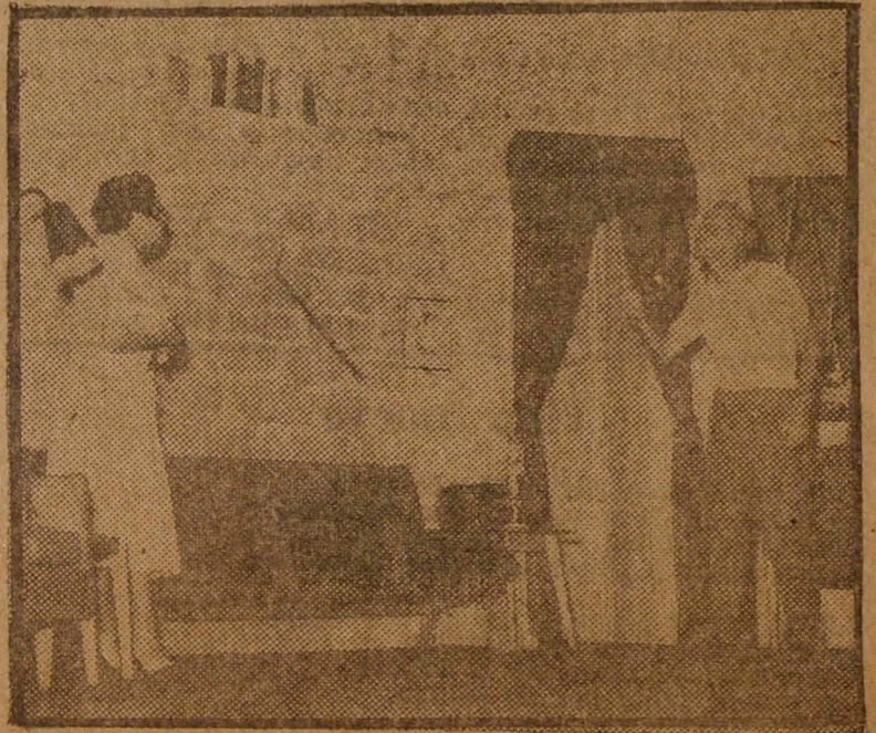
"Una noche distinta", de José Antonio Garrido.

interpretación fué deficiente y daba la impresión de estar hecha por compromiso. El estreno fué hecho con una inseguridad en la letra que demuestra poco respeto por el autor.