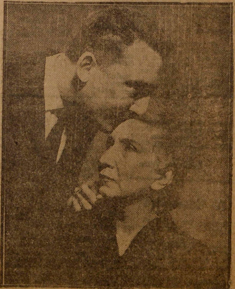
"El senador no es honorable", de Sergio Vodanovic.