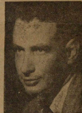
SERGIO VODANOVIC Exito teatral