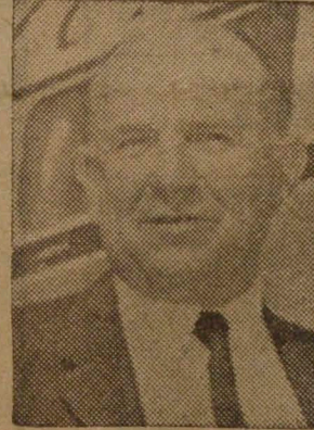
MINISTRO DE FINANZAS De regreso