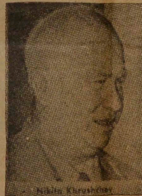
KHRUSHCHEV "... o pereceremos juntos"