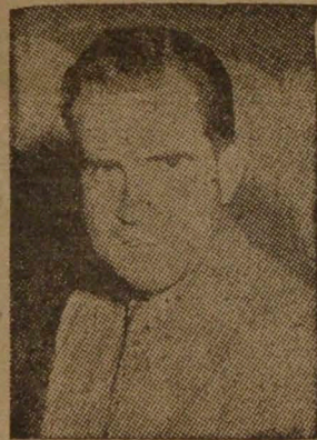
NIXON "O aprendemos a vivir juntos..."

Aquí en Santiago el cielo se ha detenido. Está parejo. Está plano, gris y