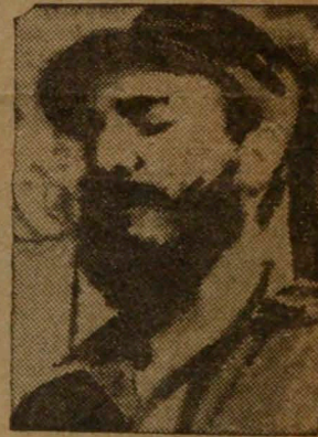
FIDEL CASTRO ¿Una nueva Guatemala?