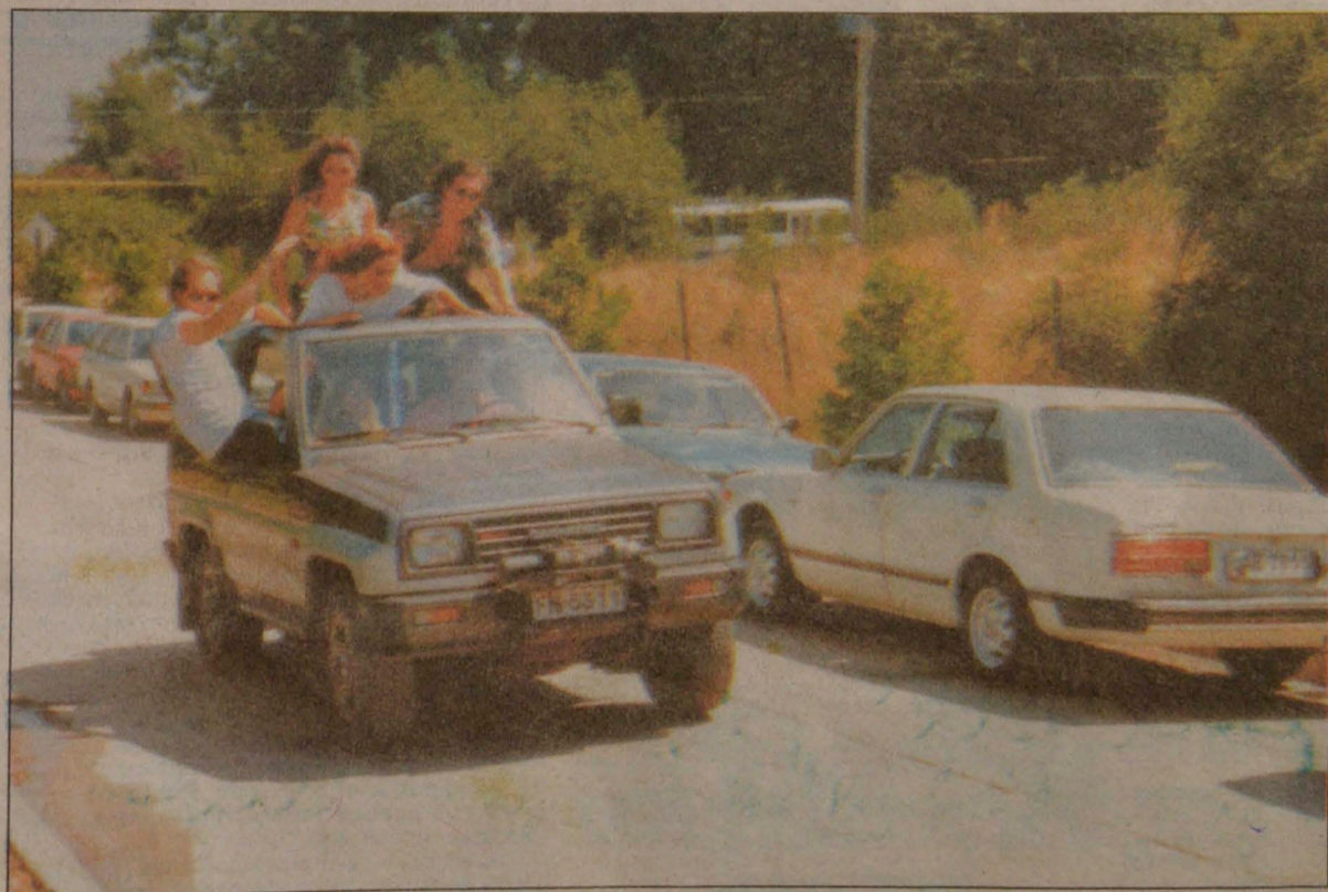
Ciertas escenas mostradas por las teleseries pueden servir fácilmente de modelos a los jóvenes en cuyos hogares no se ha desarrollado un sentido crítico para mirar la TV.