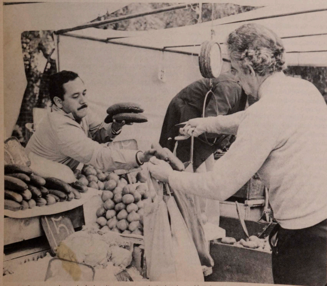
Comprando en la feria, rito que cumple todos los miércoles.

“Yo no sé si eso pasa, pero estoy tratando que así ocurra. Tal vez, sin ser yo, he tenido por otra parte la posibilidad de ser más yo misma, sobre todo cuando opto por el camino del teatro, y de la búsqueda de ideales. La forma de hablar me resulta muy familiar —muy como yo hablo—, y como decía antes, aquí hay un personaje en conflicto al que le están pasando cosas posibles, muy posibles. Yo no sé si alguien ya lo dijo, pero uno de los méritos de esta serie es que aquí no hay gente mala per se, sino gente equivocada, gente a la que la vida la puso en un camino y eligió otro. Eso ocurre en la realidad ¿no?” *