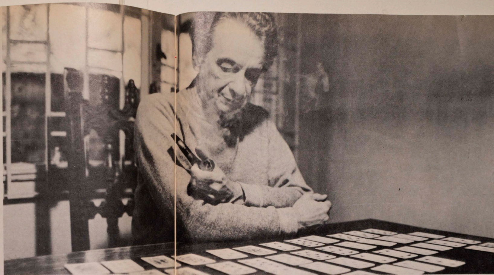
Sacando solitarios: uno de sus pasatiempos,

“Pasó que, más que entusiasmo con lo que ocurría en el escenario, descubrí que en la platea había profesores, dirigentes de la Fech y toda una “inteligentzia” que me hizo pensar que había un grupo de gente interesada en las cosas profundas. Yo había suspendido mi carrera de leyes para entrar a la Caja de Empleados Públicos, luego la reinicié, seguí como fiscal y a esas alturas había comenzado a escribir. Mi primera obra se estrenó con una compañía for-