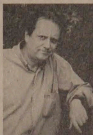
Desde 1997 se ha mantenido estable en el elenco del segundo semestre del área dramática de TVN.

Llevaba un año trabajando cuando decidí postular a la Escuela de Teatro de la Universidad de Chile, y para mi sorpresa, quedé primero en la lista de aceptados. Comencé a estudiar y también a desarrollar mi carrera de cantante. Participaba en una banda de neofolclor que se llamaba Los Paulos, donde también estaba Pedro Messone. Tal fue el éxito que en 1966 gané el Festival de Viña del Mar con la canción La Burrerita de Quillagua. Eramos el grupo sensación del momento, pero al año siguiente, cuando egresé, tuve que optar por el teatro o la música.