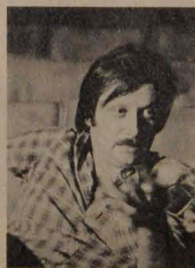
En 1985 formó la compañía de teatro La Musaraña y montó la obra de Dario Fo, Muerte Accidental de un Anarquista.