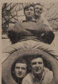
Junto al grupo Los Paulos, ganó la competencia en Viña del Mar en 1966 con la canción La Burrerita de Quillagua.