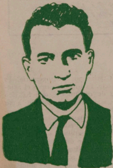
SERGIO VODANOVIC "El teatro no es un arte colectivo".