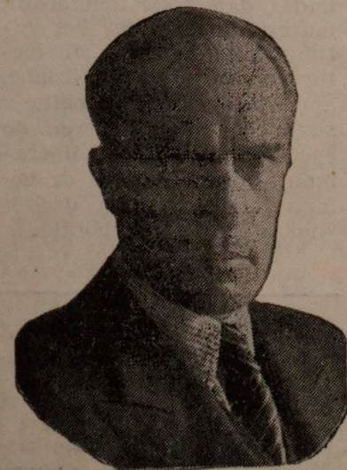
ALONE Premio Nacional de Literatura 1959.

Esta monárquica frase podría ser atribuida a Alone. El, bastante talentoso para haberla pronunciado jamás, la afirma, sin embargo, entre las líneas de sus célebres Crónicas. Parece decir: "No hay más método que el buen gusto. No hay, para mí, mejor gusto que mi gusto. No