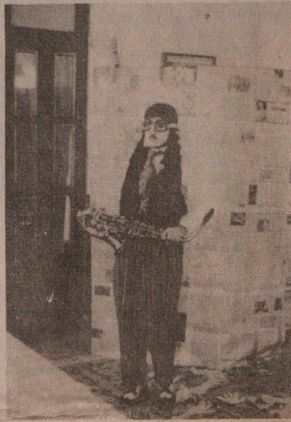
• El Tecal será el escenario para "Pescando en el espejo", obra que presenta el grupo La Tarima.