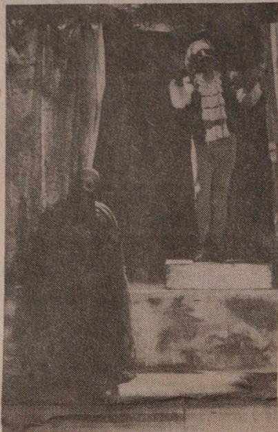
• "El diálogo del rebusque", la obra que vuelve al escenario del Teatro la Candelaria.

Las funciones comenzarán a las 7:30 de la noche, de miércoles a domingo, hasta el 14 de octubre, en la calle 12 N° 2-59. Teléfono: 2814 814.