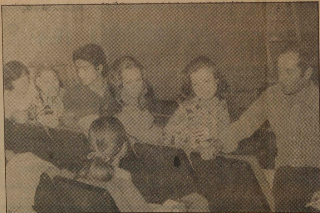
«Nuestra obra no es tradicional en cuanto a la forma de actuación...».

bido una aportación de ideas y sugerencias de cada uno. Y es que hace unos meses